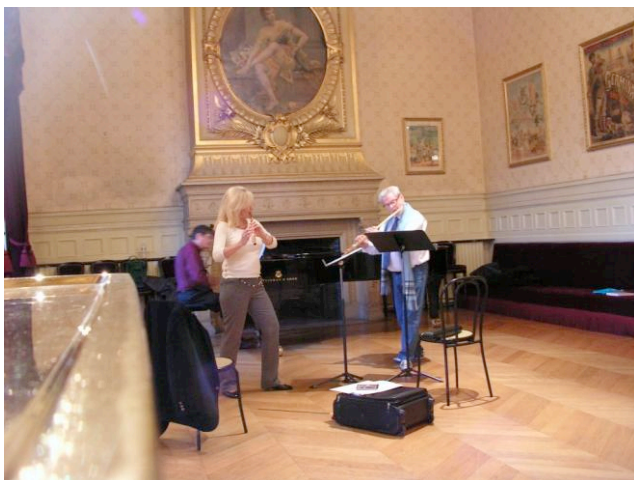
Figure 4 Foyer du Châtelet

Quitter le prestigieux Orchestre philharmonique de Berlin pour suivre une carrière de soliste à 36 ans est un risque que beaucoup n'auraient pas pris. A posteriori, il semble aisé de dire que ce fut la bonne décision, conforme à son tempérament de musicien chaleureux et cherchant le contact avec