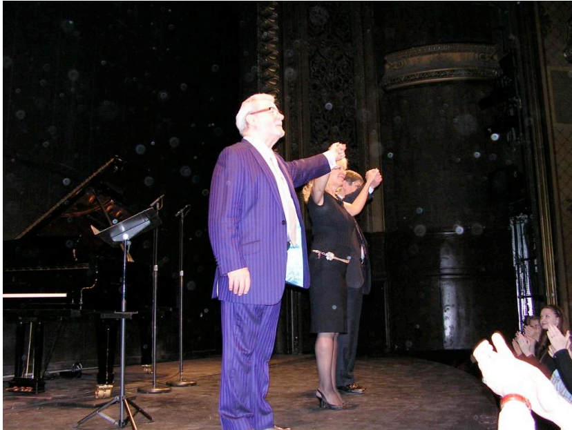
Figure 3 Standing ovation Paris Châtelet 9 novembre 2008

exigences de la partition. Jeune adolescent, James, muni d'une bourse d'études, quitte Belfast et s'installe à Londres pour suivre l'enseignement de John Francis au Royal College of Music, puis celui de Geoffrey Gilbert à la Guildhall School of Music. C'est probablement Gilbert qui a eu l'influence la plus profonde sur lui en affermissant les bases de sa technique fluide et musicale : maîtrise des gammes dans tous les tons (Gilbert lui-