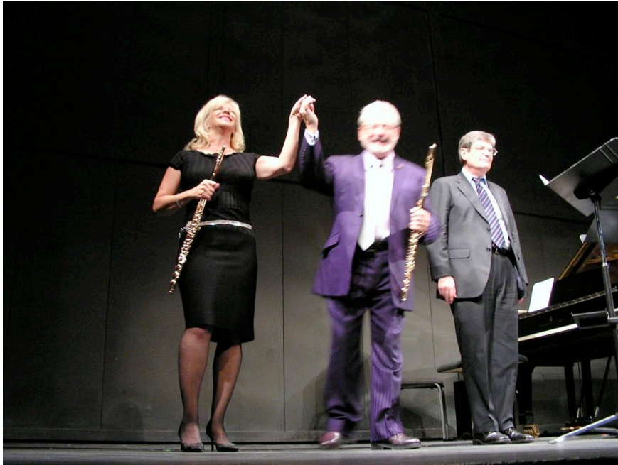
Figure 2 En scène (Châtelet 9 novembre 2009)

beaucoup sur les qualités de cette embouchure, il en fait souvent la démonstration durant ses classes de maître en insistant sur le fait que depuis plus de cinquante ans, cette embouchure ne lui a jamais fait défaut en toutes circonstances et qu'elle est la base de la fiabilité et de la souplesse de son jeu dans tous les registres, quelles que soient les